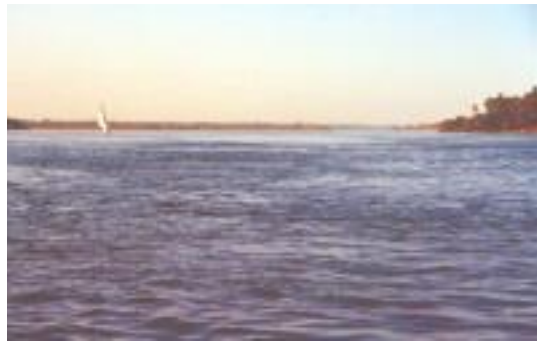
Idylle auf dem Nil

Dann waren da noch eine Autofähre vom mexikanischen Festland auf die Baja California und nicht zu vergessen die etwas kleineren Fähren in Thailand, Mexiko, Ägypten und Vietnam.