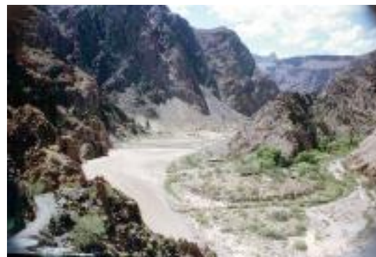
Blick in den Grand Canyon

Die meisten Nationalparks in einem Urlaub sah ich bei meiner Reise durch die USA. Angefangen bei den Everglades im Süden, weiter über den kaum bekannten, aber wunderschönen Big Bend N.P. fuhren wir in den Grand Canyon. Da waren der Yosemite in dem, wenn ich ihn ein zweites Mal bereist hätte, ich wohl auch klettern gegangen wäre, fuhren durch den Yellowstone N.P., dessen Geysire beeindruckender waren als die in Island.