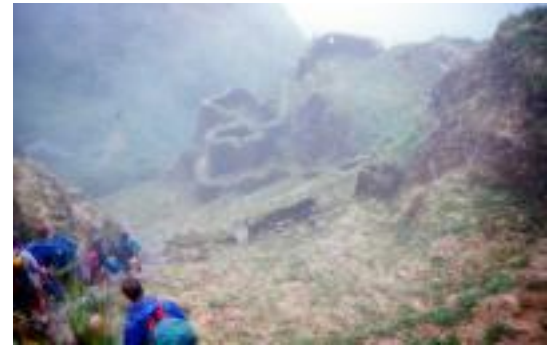
Auf dem Inka-Trail

Ein nicht alltäglicher Blick in das Tal der Könige, Luxor