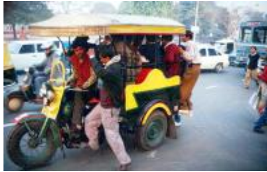
Colectivo als indische Variante

O-Bus in Quito. Dort gab es ordentliche Fahrscheine, der Bus hielt nicht irgendwo, sondern an einer Haltestelle (eine Seltenheit) und er war sauber und nicht überfüllt. In Belo Horizonte, in Mitten Brasiliens, trauten wir unseren Augen nicht. Es gab nicht nur Haltestellen, sondern auch Fahrpläne.