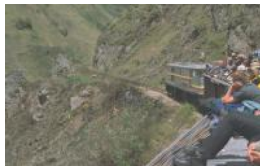
Zugfahren in Ecuador

In Peru fuhr ich von Arequipa bis zum Titicaca-See und weiter nach Cusco. Später dann von Cusco bis nach Aguas Calientes. Bei meinem ersten Besuch in Machu Pichu fuhr der Zug noch bis Quillabamba, später hatte das Wasser der Anden die Strecke teilweise weggespült. Wenigstens gibt es noch die Strecke entlang des Urubamba bis Machu Pichu. Bei meiner ersten Reise dorthin war ich mit dem Zug in der zweiten Klassen zurückgefahren. Er war hoffnungslos mit Bauern überfüllt, die nach Cusco zum Markt wollten. Da blieb dann nur noch wenig Platz zwischen den Bananenstauden.