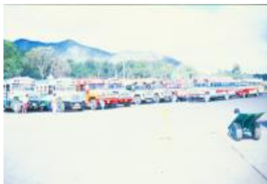
Busparade in Antigua, Guatemala

Ein Mensch den ich unterwegs traf erzählte eine Geschichte, wo der Linienbus in den Serpentin bei der Einfahrt nach Guatemala City die Camel Trophy überholte und alle Passagiere den Fahrer anfeuerten. In Indien, auf der Fahrt von Bombay nach Goa, war der Fahrer nur noch durch die Drohung mit der Polizei zu einer weniger lebensgefährlichen Fahrweise zu bewegen. Und dabei sind eigentlich Inder freundlich. Es gibt manchmal kein Abblendlicht, also wird beim Herannahen des Gegenverkehrs einfach das Licht ausgeschaltet, allerdings auch im Gebirge. Vielleicht hat der Mensch ja recht, der behauptete, dass es in Indien ein Massensterben geben wird, wenn dort die Strassen ordentlich ausgebaut sind. Ein Eindruck bekam ich jedenfalls bei der Fahrt von Delhi nach Jaipur. Die Strasse war vierspurig und in einem ordentlich Zustand, alle 10 km war ein Unfall.