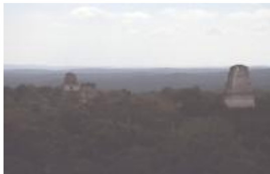
Pyramiden von Tikal und ein Blick auf den El Peten

In Mittelamerika war es die Kultur der Azteken, Tolteken und vor allem der Maya, die mich in ihren Bann zog. Meinen vierten Urlaub in diese Gegend hatte ich hauptsächlich den Maya gewidmet. Ich versuchte so gut es in drei Wochen ging, mich auf deren Spuren zu bewegen.