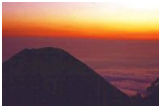
Sonnenuntergang über dem Izalco-Vulkan

Südamerika, die traumhaften Strände in Brasilien oder auch die Wasserfälle von Iguazu waren die Highlights dort. Salzseen auf dem Altiplano, Geysire in Chile oder die endlose Einsamkeit der Wüste und Salzseen, zerschnitten vom Gleis der Andenbahn, prägten sich bei mir fest ein.