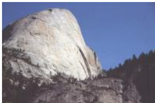
Half Dome im Yosemite Nationalpark

Der Pacaya ist ein Vulkan in Guatemala, von dessen Rand ich einmal die Lava brodeln sah und beim zweiten Versuch wegen schlechtem Wetter umdrehte. In El Salvador stand ich am Rande des Santa Ana Kraters , zu dem auch keine Strasse führte.