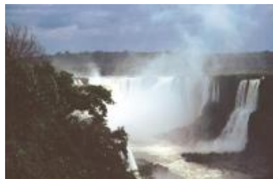
Wasserfälle in Iguazu

Die Steinwüste in Island, die Wasserfälle, Gletscher und Geysire ließen das Land doch zu einem Erlebnis werden, obwohl die weniger angenehmen Temperaturen den Eindruck leider etwas trübten.