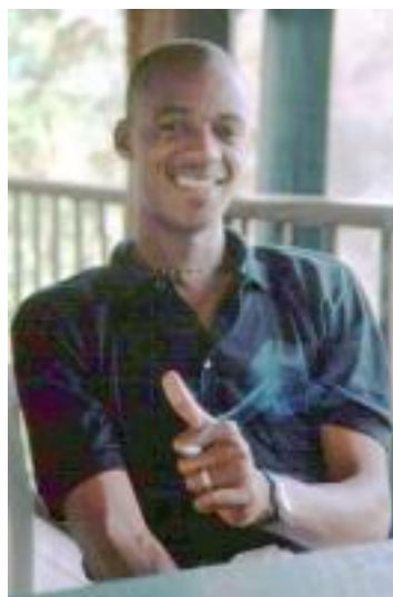
Disco-Guide in Brasilien

Auch Brasilien war ein Land der Gegensätze. Es waren einmal die erschütternden Bilder in der Favela in Rio de Janeiro und im Gegensatz dazu der nette Mensch, der für die Gästebesorgung in einem Hotel in Minas Gerais zuständig war. Er brachte uns dann mit Freunden auf eine Dorfdisko, die wir sonst nie gefunden hätten. Wir trafen jemanden, der uns am Neujahrstag mit seinem Auto Belo Horizonte zeigte und quartierten uns drei Tage in der Ferienwohnung von Bekannten eines Freundes ein, die uns auch noch versorgten.