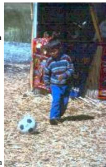
Fußball auf 3800 m, am Tititaca-See

Ein Brasilianer, den ich im Zug von Puno nach Cusco traf, leitete auch ein Umdenken bei mir ein. Ich beschwerte mich darüber, dass man in Brasilien den Amazonas-Regenwald abholzt. Als er zum Gegenschlag ausholte und mir unsere Versäumnisse in Europa vorhielt, fing ich dann auch an, hier tiefer hinter die Kulissen schauen zu wollen.