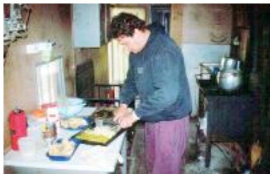
Das Mittagessen in der Andenbahn wird zubereitet

Fast immer bin ich zum Essen in ein Restaurant gegangen oder habe mir an einem Stand an der Strasse etwas gekauft. Da sah ich wie das Essen zubereitet wurde, im Gegensatz zum angeblich saubereren Restaurant. In Monterico /Guatemala in der Spanischschule war Selbstversorgung angesagt, so dass die Leute dort dann in den Genuss von Milchreis, Zucker und Zimt kamen. Und der Chef der Schule hat es sogar gegessen und auch vertragen.