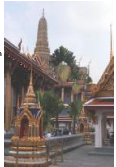
Grand Palace in Bangkok

Meist waren die Städte, die ich besuchte, klein genug um sie erlaufen zu können, wenn nicht dann habe ich öffentliche Verkehrsmittel dazu genutzt. Es waren Kolonialstädte wie Lima und San Cristobal , in denen ich die Architektur bewunderte. Da waren zum Beispiel die Museen in Mexico City, Potosi oder auch in Ouro Preto, Brasilien mit seiner Mineraliensammlung, wo ich verweilte. In Potosi, Bolivien war es nicht nur die alte Münze, es gab auch den Cerro Rico.