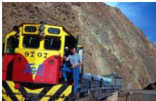
Fotostop auf der Andenbahn

Das schönste war die Fahrt über die Anden von Salta nach Socompa. Der Personenverkehr war längst eingestellt und ich wollte das Erlebnis des Zuges in die Wolken unbedingt haben. Der noch heute verkehrende Touristenzug fuhr um in dieser Jahreszeit nicht. Mir blieb nichts weiter übrig als den Versuch zu unternehmen auf der Lok eines Güterzuges mitzufahren. Und ich hatte es geschafft. Es war wohl das schönste, was ich auf allen Reisen erlebt hatte, was das Fortkommen angeht, wurde es nie übertroffen.