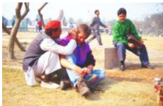
Ohrenputzer bei der Arbeit, Indien

Wie langweilig wäre die Zugfahrt mit der Andenbahn ohne die vier Lokführer gewesen. Hier erfuhr ich das erste Mal über die Probleme Argentiniens , als das Geo Special noch von einem aufstrebenden und blühenden Land schrieb. Oder auch der Busfahrer auf der Fahrt von Buenos Aires nach Iguazu, der mir erklären musste was Mate ist und danach mich damit versorgte.