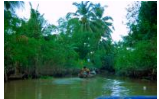
Nur noch mit dem Boot geht es durch das Mekong-Delta

Fünf Stunden dauerte die Fahrt auf einem gemieteten Kahn (der vorgesehene Lastkahn war leider weg) durch den Peten, um von Guatemala nach Mexiko zu kommen. Es ging durch Gegenden, durch die sonst kaum ein Tourist kommt, geschweige denn einen Fuß hinsetzt. Es waren fünf Stunden fast allein auf dem Rio de la Pasion in Mitten des Regenwaldes. Am Ende der Fahrt ging dann noch der Motor des Boots kaputt, aber irgendwie kamen wir an.