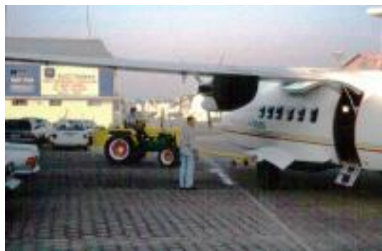
Atlantic Airlines wartet auf den Abflug in Guatemala City

Eine Stunde sollte der Flug für die 200 km von Santa Cruz nach Sucre dauern und um halb acht starten. Das war dann auch die Zeit, wo der Klebmeister seinen Zweikomponentenkleber anrührte und das Cockpit-Fenster befestigte. Acht Stunden später tauchte er dann fast pünktlich zum Abflug wieder auf und reparierte eine abgefallene Armlehne der altersschwachen 727 mit Tesafilm. Dann ging es wirklich los. Und als krönenden Abschluss sahen wir die wohl interessanteste Gepäckumhüllung auf dem Band vorbeierollen: Eine Mülltonne!