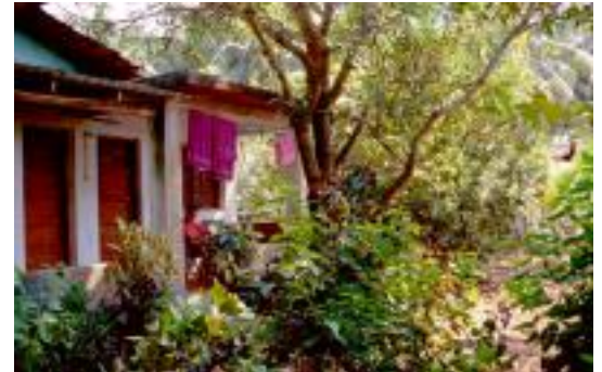
Unterkunft in Colva Beach, Indien

Auch was die Unterbringung angeht, es war von allem etwas dabei. In Island war es ein Zelt, was sich dann im nachhinein als nicht ganz zweckmäßig erwies, jedenfalls nicht für den Spätsommer. Dann kamen diverse Bruchbuden überall auf der Welt hinzu. Die billigste Unterkunft war das Doppelzimmer für 1.50 Euro pro Person in einem absolut herrlich gelegenen Haus in Colva Beach/Indien. Die Unterkunft mit dem besten Preis-/Leistungsverhältnis war auch in Indien. Wir zahlten 5 Euro pro Person für das Doppelzimmer inklusive Vollpension bei der Heilsarmee in Bombay.