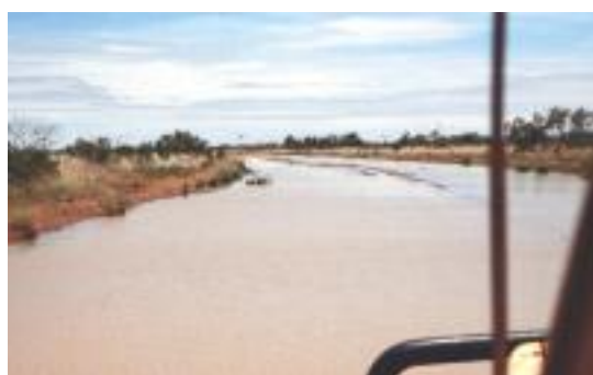
Piste im Outback von Australien

Mit dem eigenen Auto bin ich drei Mal unterwegs gewesen. Zum Eingewöhnen war es die USA. Wer das Autofahren liebt, gerne lange Strecke in Ruhe zurücklegt, der wird sich dort wohlfühlen. Keiner drängelt, Raserei ist verpönt und traumhaft schöne Natur lassen dieses Land zu einem Erlebnis werden. Am Anfang ist man noch über die gigantischen Kreuzungskonstruktionen der Highways erstaunt, woran man sich aber schnell gewöhnt. Mit dem Mietwagen sind wir 6 Wochen eine große Runde durch die USA gefahren und haben kurz Kanada gestreift. Es ging durch die Everglades in Florida und über eine Stafette von Brücken nach Key West. Wir haben die trostlosen Gegenden von Texas durchquert, durch die Highways manchmal kilometerlang ohne irgendeine Kurve führten. Dann waren da wieder die Serpentinaen auf den kleinen Strassen, die durch die Nationalparks führten. Wir haben uns durch Städte wie New York gekämpft und sind in San Francisco über die Golden Gate Bridge gefahren.