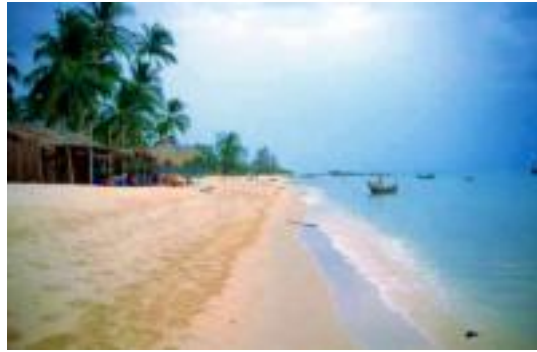
Traumstrände in Vietnam

Wortschatz hatte ich in Quechua. Nur Hindi, was ich auf dem Fischerboot in Indien wirklich gebraucht hätte, wollte einfach nicht über meine Lippen kommen.