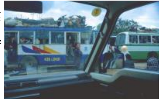
Transportiert wird alles, Linienbus in Vietnam

Da waren die Touri-Busse im selben Land, welche einen englischsprachigen Guide an Board hatten und an jeder Sehenswürdigkeit hielten. Und was da nicht alles rumfuhr, gebaut und konstruiert von den Franzosen nach dem 2. Weltkrieg und seit dem am Leben erhalten. Die Konstrukteure wären heute stolz auf ihr Werk.