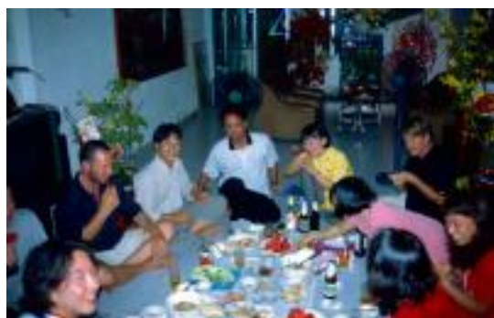
Neujahrsfeier in Saigon

Obwohl die Menschen in Asien vom Charakter doch anders sind, so hat es mir auch dort immer wieder Spaß gemacht mich lange mit ihnen zu unterhalten. Aber da gab es die Sprachbarriere. Manchmal ging es wirklich nur noch mit den sprichwörtlichen Händen und Füßen, aber fast immer konnten wir uns irgendwie verständigen.