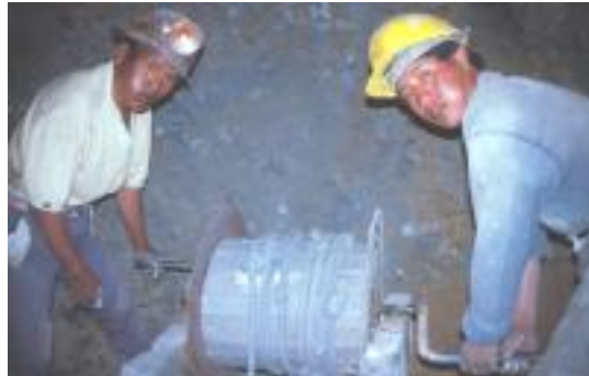
Bergarbeiter im Cerro Rico, Potosi

Dieser Berg ist ausgehöhlt wie ein Schweizer Käse und was ich dort sah, erinnerte sehr stark an ein Bergbaumuseum des Mittelalters. Zwei Stunden wurden wir durch die Stollen geführt und böse Zungen behaupteten, die Führer würden absichtlich ein solches Tempo machen um den Touristen einen Eindruck zu verschaffen wie es ist, wenn man in diesem Berg