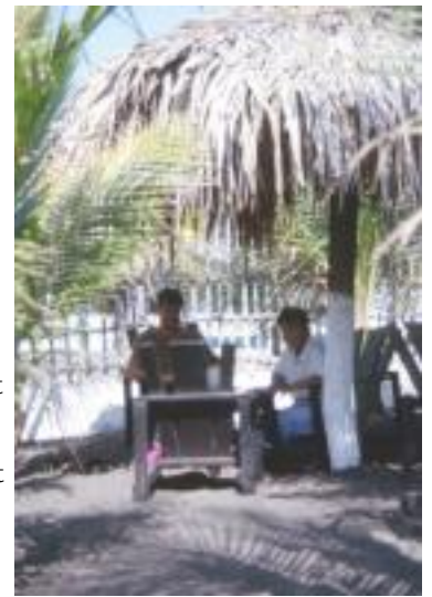
Spanischunterricht in Monterico, Guatemala

Wenn es die Möglichkeit gab, dann hatte ich auch gern gefaulenzt. Strände waren ein Magnet für mich. Ich hielt es doch nie sehr lange dort aus. Das Gefühl weiterziehen zu müssen, war meist stärker. Aber bei der nächsten Gelegenheit hatte