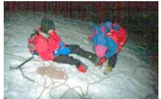
Mit der Kraft am Ende, Chimborazo in Ecuador

In Ecuador bin ich beim Versuch den Chimborazo zu besteigen gescheitert. Bei 5600 m hatte ich noch einen Gletscher erklommen, die Androhung eines weiteren nahm mir jeden Mut, Kraft hatte ich sowie keine mehr. Aber wenigstens hatte ich diese Höhe einmal erreicht. Am Ende hatten wir dann noch viel Bier spendiert, weil unserer Führer, ohne den es wirklich lebensgefährlich gewesen wäre, uns vor dem Absturz im Gletscher bewahrte.