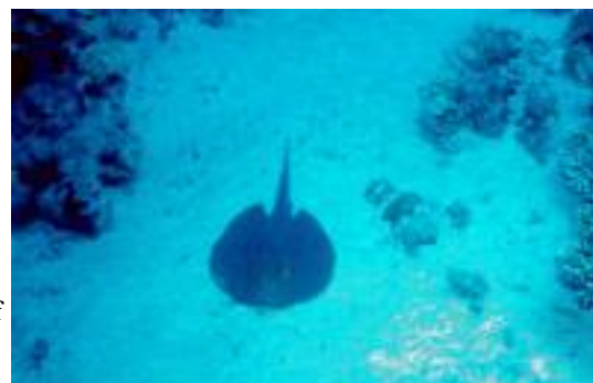
Rochen im Roten Meer

Es gab zwei Meeresbewohner, die ich gern beim Tauchen gesehen hätte, das waren Delphine und Walhaie. Aber was ich sah, reichte eigentlich aus: Riffhaie, einen Teufelsrochen, kleine Rochen oder auch Stein- und Feuerfische. Aber nicht immer waren es die großen Fische, manchmal war das Aufstöbern der Kleinen genauso spannend, oder das Erblicken der wundervollen Nacktschnecken im Chinesischen Meer.